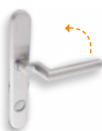
Poignée 2058 extérieure et intérieure avec plaque ES1 RZ 5717 / PZ 5747