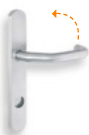
Poignée standard avec plaque ES1 Standard actionné par poignée RZ 5706 / PZ 5716