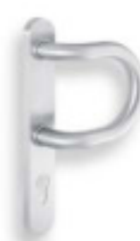
Poignée arrondie avec plaque ES1 RZ 5703 / PZ 5713