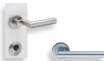
Poignée Goll Fortis (pas pour AluLine AL1) avec rosaces, ressort de rappel de poignée intégré extérieur avec protection de pouce, intérieur avec forme d'angle RZ 5705 / PZ 5715