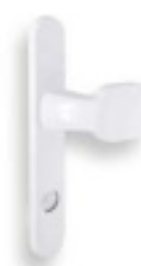
Garniture à levier coudée RZ 5708 / PZ 5718