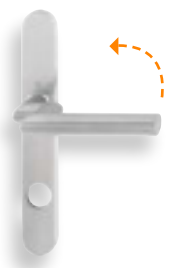
Hoppe E1400GF2 avec poignée Amsterdam classe de résistance ES1 RZ 5744 / PZ 5771