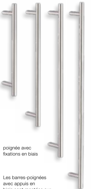
poignée avec fixations en biais

Les barres-poignées avec appuis en biais sont montées sur le profilé du vantail.