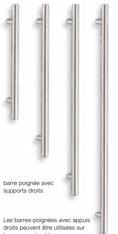
barre poignée avec supports droits

Les barres-poignées avec appuis en biais sont montées sur le profilé du vantail.