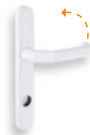
Poignée avec plaque RZ 5701 / PZ 5711