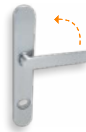
Garniture pour volet roulant 2035S/5557, poignée extérieure basse avec plaque ES1 RZ 5831 / PZ sur demande