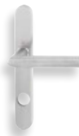
Hoppe E1400F vue intérieure, poignée classe de résistance ES1